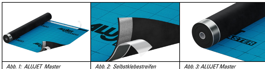
Abb. 1: ALUJET Master